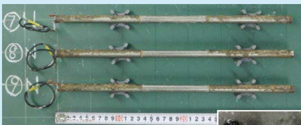
補修材Bの鉄筋腐食状況